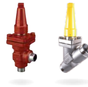
SVL Flexline™ – Composants de ligne

Tous ces produits sont élaborés selon une même conception modulaire d'un corps unique. Cette configuration permet de réduire la complexité depuis la phase de conception jusqu'à l'installation, la mise en service et la maintenance. Tous ces facteurs sont déterminants pour la réduction des coûts d'entretien, et permettent de réaliser d'importantes économies.