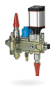
ICF Flexline™ – kompletne stacje zaworowe