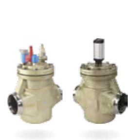
ICV Flexline™ – zawory regulacyjne

Zaprojektowana z myślą o inteligentnej prostocie, ekonomicznej skuteczności oraz zaawansowanej elastyczności seria Flexline™ obejmuje trzy popularne kategorie produktów: