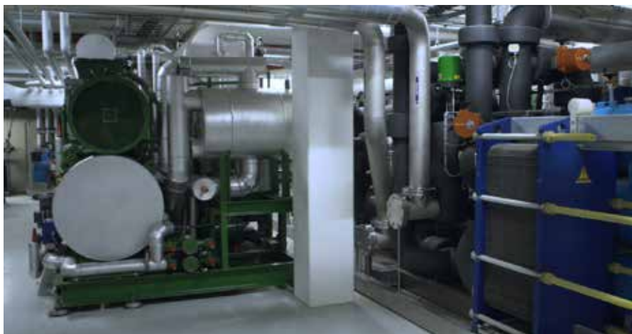
L'eau refroidie provenant de l'échangeur de chaleur circule dans le bâtiment pour refroidir les chambres à la température souhaitée. Aucune réfrigération active n'est requise.

provenant de l'échangeur de chaleur circule dans le bâtiment pour refroidir les chambres à la température souhaitée. Aucune réfrigération active n'est requise. Le coefficient de performance peut atteindre une valeur de 40, ce qui signifie que la capacité de refroidissement équivaut à 40 fois l'électricité consommée par l'installation.