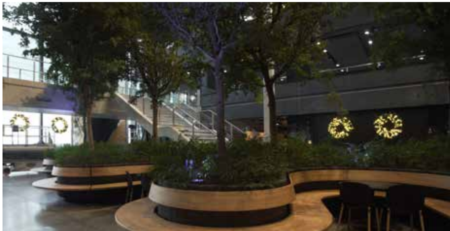
Le système de chauffage et de refroidissement par les eaux souterraines et les panneaux solaires sont les fondements du profil écologique de l'hôtel.

Le système de refroidissement par les eaux souterraines a nécessité deux phases de forage à une profondeur de 110 mètres dans deux endroits proches de l'hôtel. En été, l'eau froide à 7-9 °C provenant du sol est pompée dans l'un des puits dans les caves de l'hôtel, avant de passer dans un échangeur de chaleur et d'être renvoyée dans un réservoir de chaleur où la chaleur s'accumule et est stockée pendant les mois plus chauds. L'eau refroidie