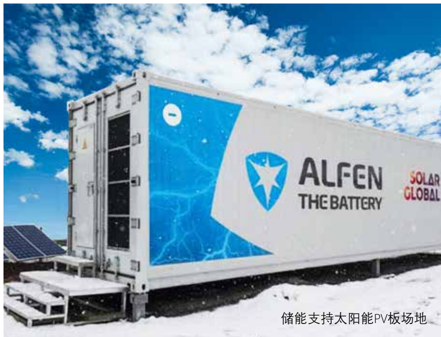
储能支持太阳能PV板场地

Solar Global 开发并服务了太阳能板场地，带有房顶太阳能 PV 板安装。目前已有 100MW 容量投入使用。Solar Global 在能源转换方面的前沿扮演很重要的角色。在创新的储能方案方面的投入，也会被用于能源交易。随着本地市场的进一步发展，这样的系统也可以用于服务其他的应用，例如保持电网稳定的服务。