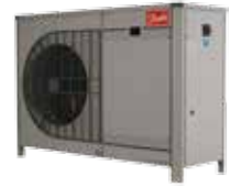
Tabla de capacidad