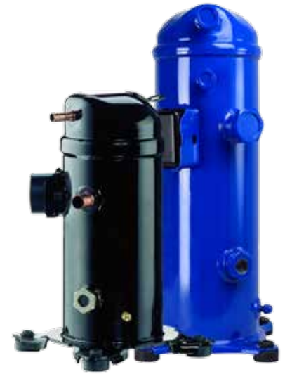
MLZ kompressori voi olla sininen tai musta, valmistuspaikasta riippuen.