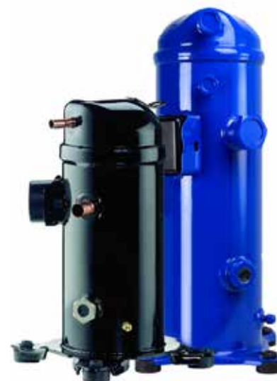
Les compresseurs MLZ peuvent être bleus ou noirs, selon leur origine de production.