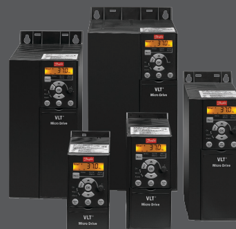
VLT® Micro Drive FC 51