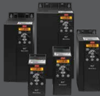
VLT® Micro Drive FC 51