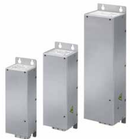
Wielkości obudów Trzy różne rozmiary obudów filtrów liniowych odpowiadają obudowom M1, M2 i M3 VLT® Micro Drive