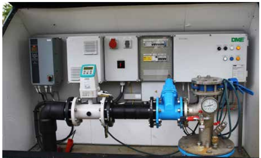
Danfoss frekvensomformere, type VLT® AQUA Drive FC202 med Profibus og indbygget indgangsafbryder monteret ude ved pumpebrønd.