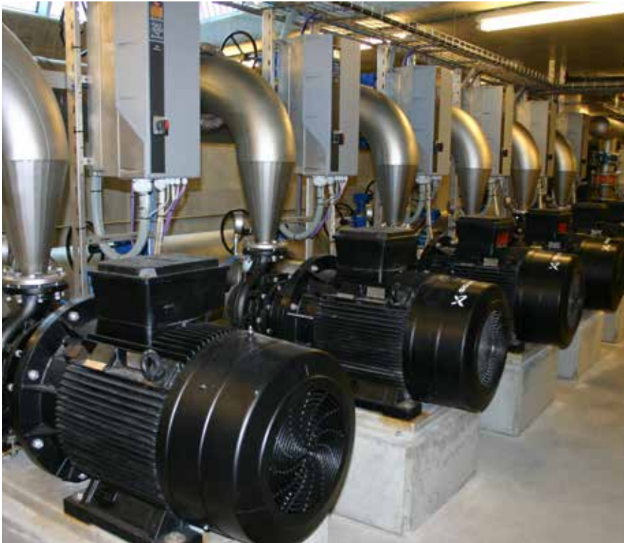
Alle 15 store pumper på vandcentret er forsynet med Danfoss frekvensomformere, type VLT® AQUA Drive FC202 med Profibus.