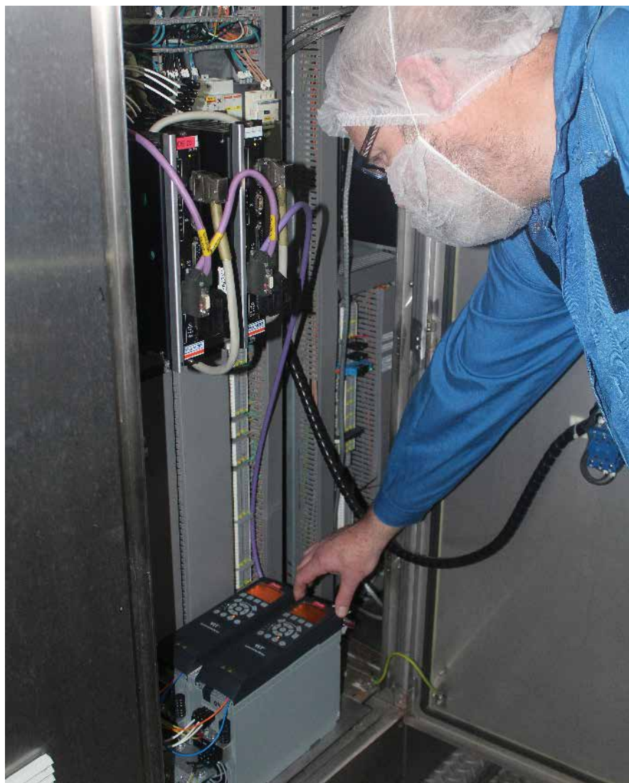
VLT® AutomationDrive med Integrated Motion Controller giver store omkostnings- og tidsbesparelser hos Danish Crown.

Positionering og synkronisering udføres typisk ved hjælp af et lukket sløjfe servosystem – dette på trods af at mange af disse applikationer ikke