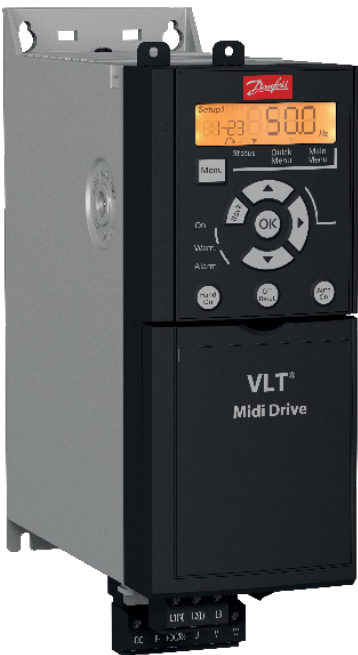
VLT® Midi Drive FC 280