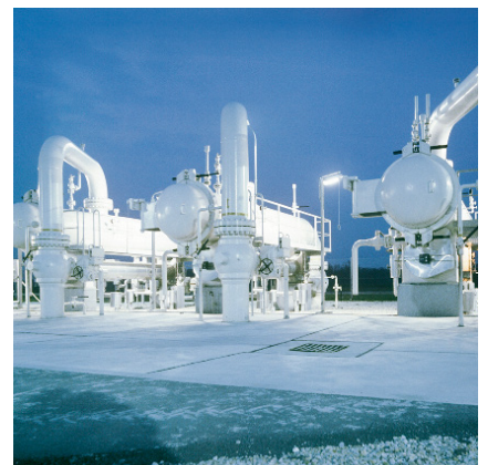
Schiebelovi aktuatorji zagotavljajo natančno krmiljenje za širok spekter različnih panog, tudi v ekstremnih klimatskih in težavnih pogojih.