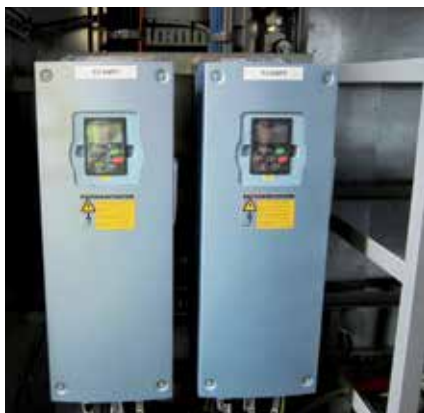
冷却水泵的变频器