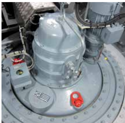
一个 Schottel 推进器