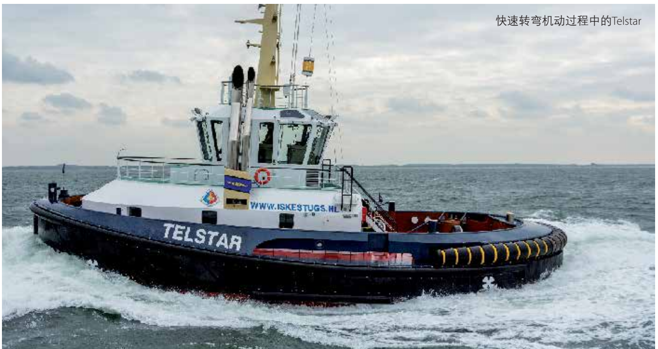
快速转弯机动过程中的Telstar

推进方式: 全回转推进 推进器: 2x Veth 型号: Z-drive VZ 1800 螺旋桨直径: 2600 mm