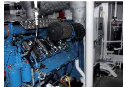
在行驶及轻载拖船时由Scania柴油发动机提供动力。