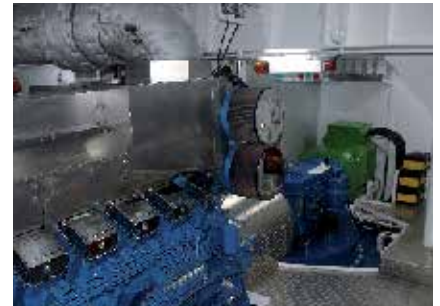
两台Mitsubishi主发动机之一，带Veth全回转推进器和永磁电动机/发电机。主发动机仅用于重载拖船应用。

纯电动运行时，船舶速度为10节（18.5 km/h），结合主柴油发动机时最大航速可增加至13.5节（25 km/h）。电动运行可大幅节省燃料成本。但是，由于拖船经常会突然需要峰值动力，所以主发动机会随时待命以满足相关需求。