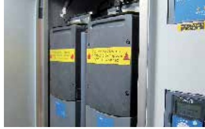
拖带绞车（左图）和用于拖带绞车的 VACON® NXP变频器（右图）