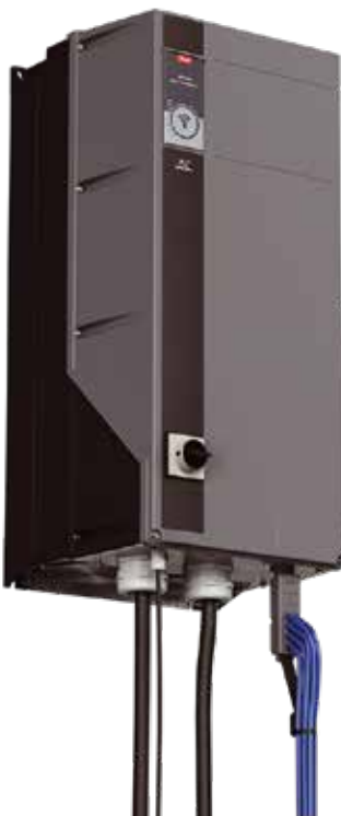
Die PTU 025 kann einfach an das Gehäuse des FC 102 Frequenzumrichters montiert werden und bietet 360°-Zugang für einen problemlosen Schlauchanschluss.

Die Montage an das Gehäuse des VLT® HVAC Drive ist ganz einfach. Auch eine Nachrüstung von vorhandenen Frequenzumrichtern ist möglich.