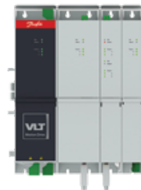
VLT® Multiaxis Servo Drive MSD 510