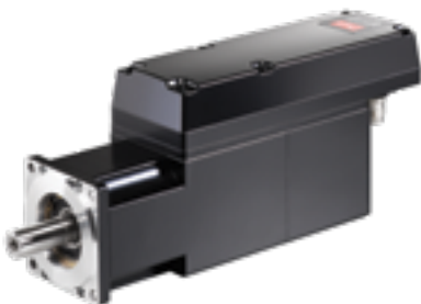
VLT® Integrated Servo Drive ISD® 510

VLT® Multiaxis Servo Drive MSD 510 是一个通用型多轴系统，可完美集成分布式变频器。该伺服系统由电源模块 (PSM 510)、驱动模块 (SDM 511、SDM 512)、分布式访问模块 (DAM 510) 和辅助电容器模块 (ACM 510) 组成。模块提供两种外形尺寸，宽度分别为 50 和 100 毫米。它支持 EtherCAT®、POWERLINK® 和 PROFINET® IRT 等基于以太网的协议，具有一个内部制动电阻器和一个安装板，安装板中包括直流回路和辅助电源。这种安装板“click and lock”解决方案使得安装既简单又安全。