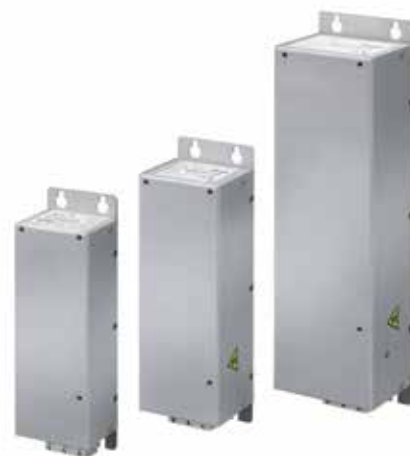
Afmetingen De verschillende netfilters komen overeen met de M1, M2 en M3 behuizingen van de VLT® Micro Drive