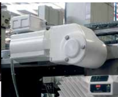
De VLT® OneGearDrive® Standard met een aansluitkast (er is een optionele rem leverbaar).