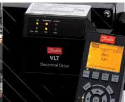
Voor een eenvoudige parameterinstelling kan de LCP 102 (de grafische besturingseenheid van de FC-serie) worden aangesloten.