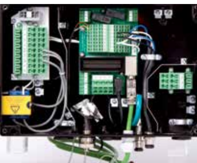
Snelle installatie en inbedrijfstelling, dankzij de klemmenkast met geïntegreerde T-verdelers van de FCD 302.

1 Gemonteerd op een paneel buiten de hygiënekritische/natte omgeving.