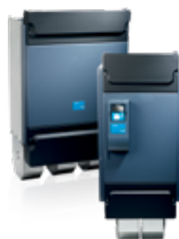
VACON® NXP МОДУЛЬНЫЕ ПРИВОДЫ ПЕРЕМЕННОГО ТОКА