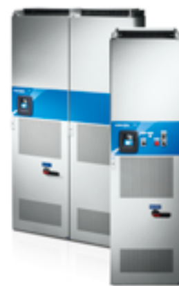
VACON® NXC ПРЕОБРАЗОВАТЕЛИ ШКАФНОГО ИСПОЛНЕНИЯ