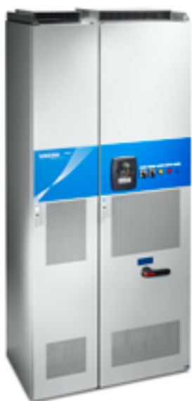
VACON® NXC С НИЗКИМ УРОВНЕМ ГАРМОНИК (AF10)