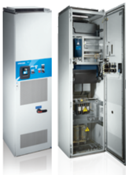
VACON® NXC (ТИПОРАЗМЕР FR10)

Закрытые преобразователи частоты VACON® NXC компактны и полностью соответствуют работе в суровых условиях эксплуатации. Обычно они работают в таких отраслях, как горнодобывающая, нефтегазовая, водоподготовка и очистка сточных вод. Надежная термообработка корпуса гарантирует длительный срок службы преобразователя частоты и бесперебойную работу в тяжелых условиях окружающей среды. Сертифицированные по ЭМС решения обеспечивают надежную работу преобразователя без создания помех другим электрическим компонентам.