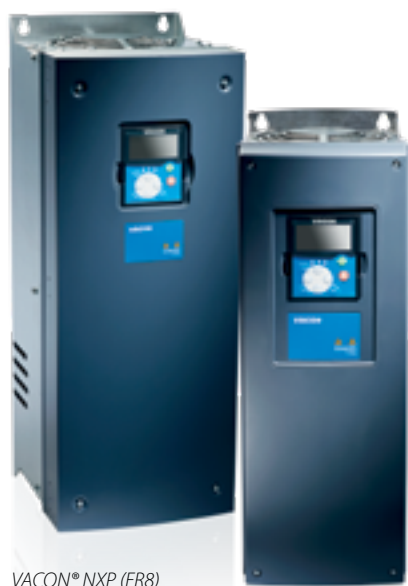
VACON® NXP (FR8)

Преобразователи частоты VACON® NXP настенного исполнения снабжены встроенным фильтром ЭМС, а силовые электронные компоненты защищены цельнометаллическим корпусом. Преобразователи частоты меньших типоразмеров (FR4-FR6) содержат встроенный тормозной прерыватель, при этом модули с напряжением 380-500 В могут комплектоваться встроенным тормозным резистором. Для преобразователей частоты больших типоразмеров (FR7-FR9) тормозной прерыватель может устанавливаться опционально.