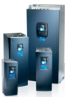
VACON® NXP НАСТЕННОГО ИСПОЛНЕНИЯ

Являетесь ли вы производителем оборудования (OEM), системным интегратором, представителем известной торговой марки, дистрибьютором или конечным пользователем, компания Danfoss Drives предоставит услуги, чтобы помочь вам достигнуть намеченных целей в бизнесе. Наша всемирная служба технической поддержки доступна круглосуточно, без выходных и на протяжении всего жизненного цикла оборудования, поскольку мы хотим свести к минимуму общую стоимость владения и нагрузку на окружающую среду.