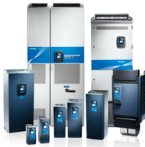
АССОРТИМЕНТ ИЗДЕЛИЙ VACON® NXP/NXC