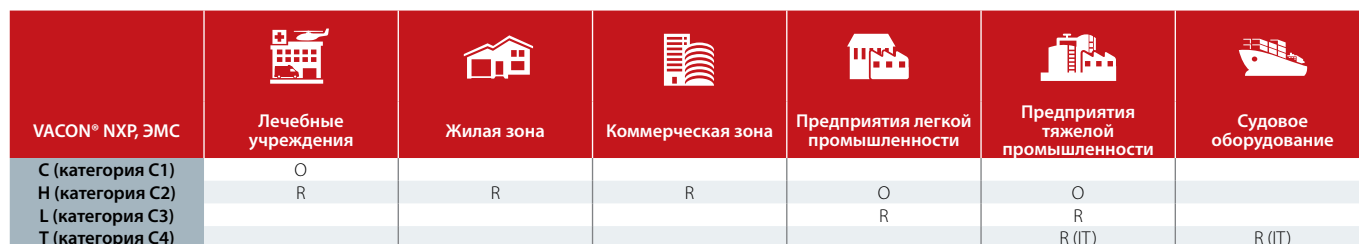
ТАБЛИЦА КЛАССОВ ЭМС

Применяемый для данного типа продукции стандарт EN61800-3 накладывает ограничения как на величину излучения, так и на помехоустойчивость оборудования в радиочастотном диапазоне. Окружающая среда в соответствии с данным стандартом делится на 1-ую и 2-ую зоны, т. е. на практике, соответственно на бытовые и промышленные сети.