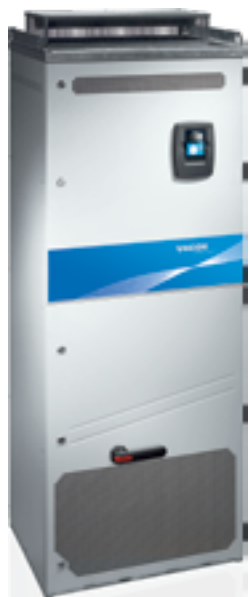
VACON® NXP НАПОЛЬНОГО ИСПОЛНЕНИЯ (ТИПОРАЗМЕР FR11)