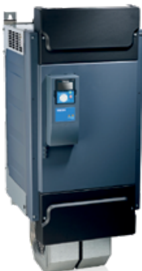
ПРЕОБРАЗОВАТЕЛЬ ЧАСТОТЫ VACON® NXP МОДУЛЬНОГО ТИПА (ТИПОРАЗМЕР FR10)

Преобразователь частоты VACON® NXP модульного исполнения типоразмеров FR10 - FR12 содержат по одному (FR10 и FR11) или два (FR12) силовых модуля. Типоразмеры FR13 - FR14 модулей VACON® NXP содержат от двух до четырех некоммутируемых выпрямителей (NFE) и один (FR13) или два (FR14) преобразователя. В поставку включены также дроссели переменного тока. Модули VACON® NXP выпускаются как для 6-пульсного, так и для 12-пульсного питания.