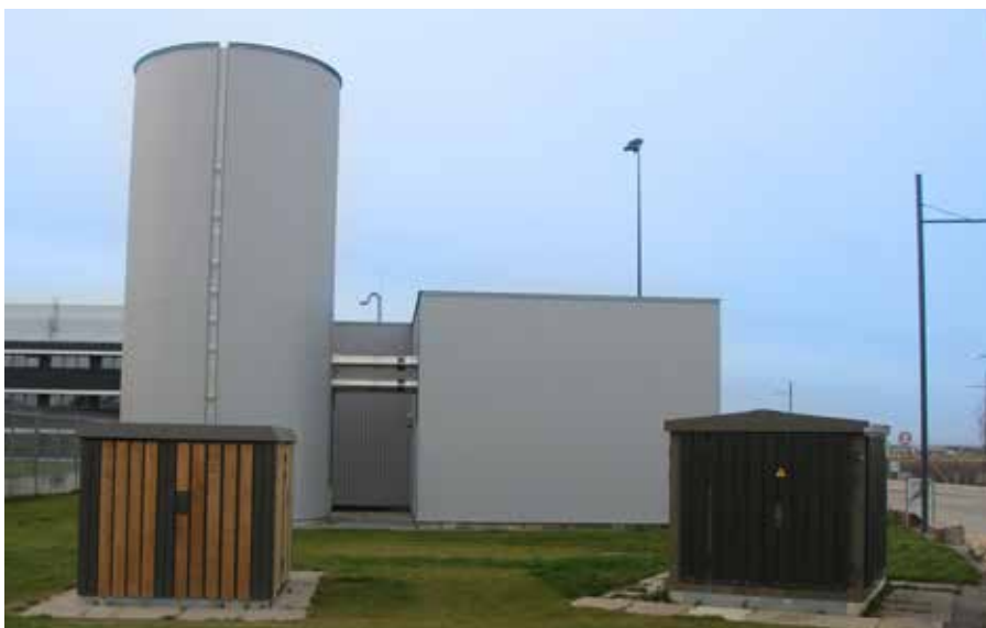
FlexHeat-anlægget oplagrer termisk energi svarende til et "virtuelt batteri" på 4 MWh i lagertanken på 100 m 3 i venstre side af billedet.

I fjerde modus er det lagertanken, som leverer varmen ud til kunderne, men hvis vandet øverst i tanken er lidt for koldt, kan der skiftes til modus fem, hvor der er mulighed for at varme det op ved hjælp af en elkedel i stedet for at starte grundvandsvarmepumpen op på u hensigtsmæssige tidspunkter. Dette er vigtigt for systemets fleksibilitet, da varmepumpen ikke kan tåle at blive tændt og slukket med for korte mellemrum og derfor helst skal køre nogle timer i træk. Elkedlen giver mulighed for at tilføje et lille boost i temperatur, så anlægget kan levere varmen ud til kunderne fra lagringstanken i de timer, hvor elpriserne er højest.