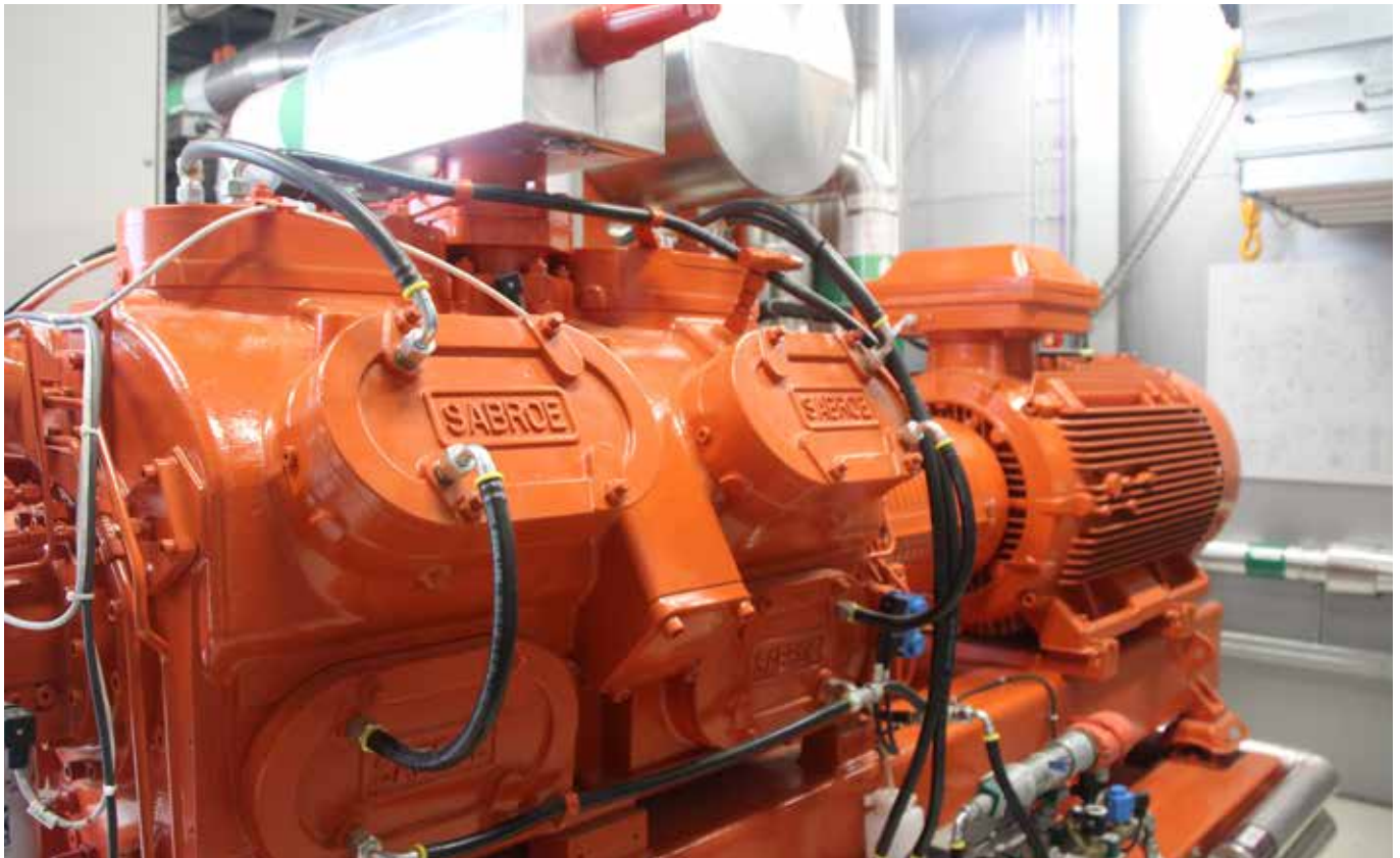
Varmepumpen styret af frekvensomformere sender ca. 70 °C - 80 °C grader varmt vand ud i systemet, og får ca. 40 °C grader varmt vand retur til centralen. Anlægget er leveret og monteret af Johnson Controls Aps med rådgivning fra COWI A/S.

varmepumper med termisk lagring forbruger strømmen, når den er rigelig og derfor også billig, og undgår at bruge den i perioder med spidsbelastning i systemet, f.eks. sidst på eftermiddagen, hvor de fleste mennesker kommer hjem fra arbejde og tænder for lys og husholdningsapparater. Et mønstereksempel på denne type sektorkobling finder vi i HOFOR's FlexHeat projekt i Nordhavn i København. Det termiske energilager svarer til et "virtuelt batteri" på 4 MWh.