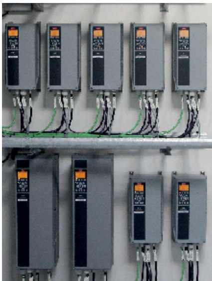
MEC – BioGas heeft voor een aantal van hun VLT® AutomationDrive FC 302 frequentieregelaars gekozen voor behuizingsklasse IP 55, omdat die bij uitstek geschikt is voor installatie in veeleisende omgevingen.