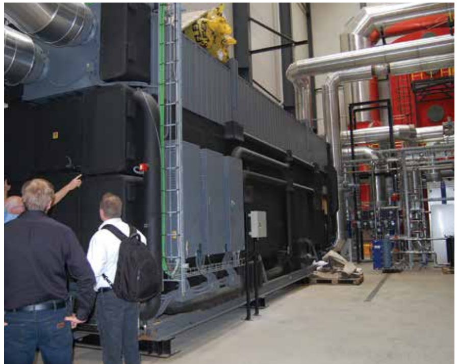
I forgrunden en absorber. I baggrunden skrubberne.