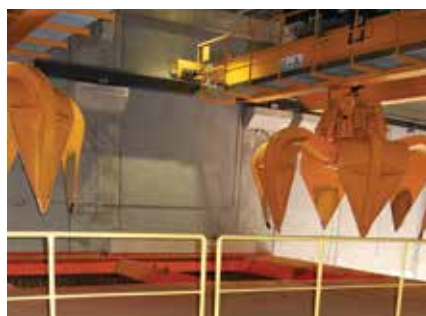
Kran til læsning af forskellige brændsler

SynRM motorer er mere energieffektive end ASM motorer. IE4 SynRM motorer overgår IE4