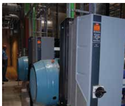
IE4 SynRM motorer med VLT® AutomationDrive FC302 frekvensomformere

asynkronmotorer hvad angår virkningsgrad ved delhastighed og dellast ved effektstørrelser over 75 kW. For motorer under 75 kW, kan ASM motorer kun klare IE3. SynRM tab er væsentligt lavere ved dellast - her har SynRM en klar fordel i forhold til ASM motorer. Da projektet skulle betales i april 2013, kostede det 20% mere at få IE4 klassificerede motorer sammenlignet med IE3. Sådan er det ikke længere. Priserne falder og i Danmark koster en IE4 SynRM motor nu det samme som en ASM motor klassificeret IE3.