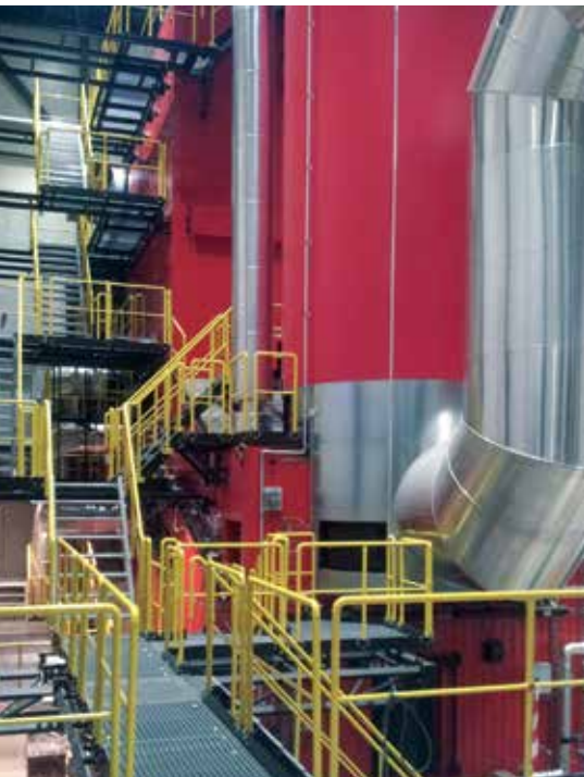
Vertikal biobrændselskedel og rensning af røggas

2 års tilbagebetalingstid på IE4 SynRM motorer ved dellast 7 års tilbagebetalingstid på hele anlægget