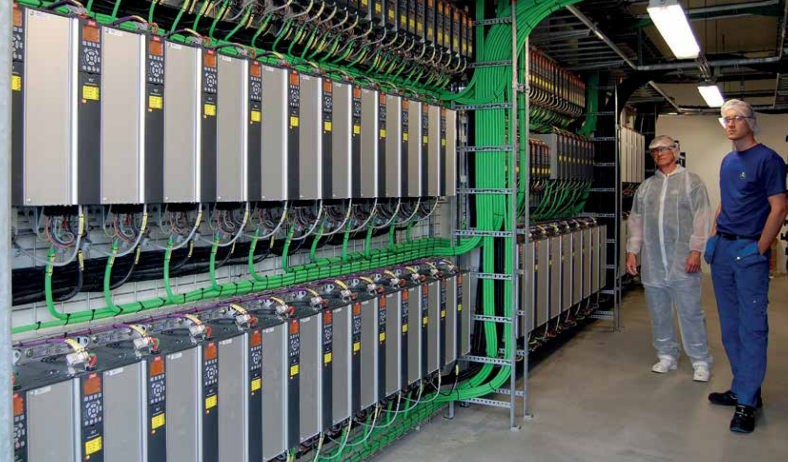
1400个 VLT® 变频器安装在一系列通风良好的控制室内，无需控制柜。 Knud Rahbek (左) 和维护经理 Simon Arentoft