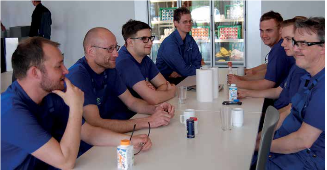
Arla 服务技术人员正在享受休息时光