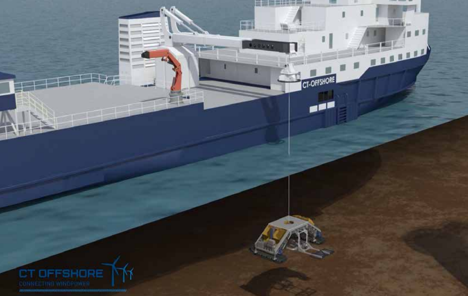
如何将 ROV 下放到海床上