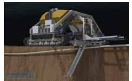
如何将电缆埋设在海床下

所有处理、提升和强制铺设电缆的操作都可能导致电缆出现疲劳损伤风险。因此必须使用 VLT® 变频器小心控制 ROV 泵，保证精确下埋电缆，以便在整个海底电缆生命周期范围内提高安全性和稳定性。