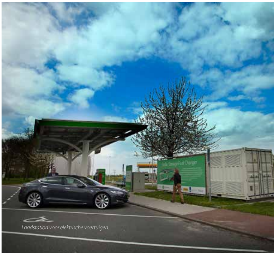
Laadstation voor elektrische voertuigen.

(netbeheerder) en MisterGreen (EV-lease) hebben dit proefproject inmiddels geëvalueerd en tot een succes verklaard: de piekbelastingen namen af, er ontstond maximale flexibiliteit in het hanteren van variabele tarieven en er vond een verdere verduurzaming van het laadstation plaats.