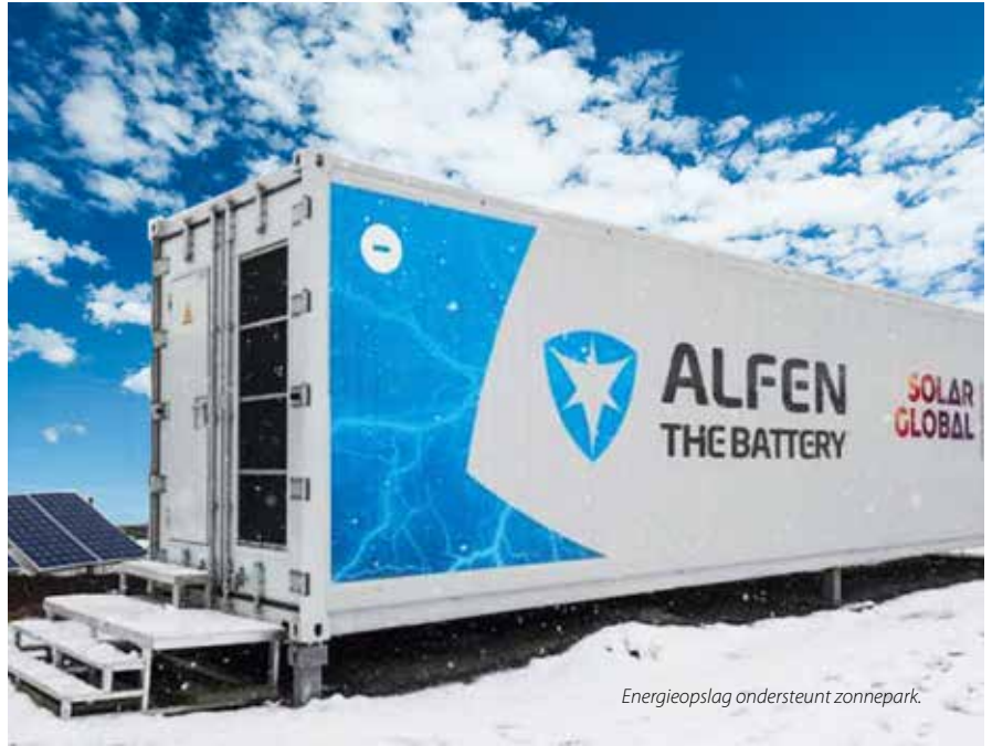
Energieopslag ondersteunt zonnepark.

Solar Global ontwikkelt en onderhoudt zonneparken en zonnepaneelinstallaties op daken en beheert op dit moment zo'n 100 MW aan capaciteit. Omdat Solar Global een toonaangevende rol wil spelen in de energietransitie, investeert de onderneming in een innovatieve energieopslagoplossing, die in eerste instantie wordt ingezet voor energiehandel. Het systeem is echter ook geschikt voor andere toepassingen, zoals het leveren van diensten voor netstabiliteit, wanneer de lokale ontwikkelingen hierom vragen.