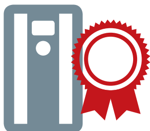
DrivePro® Extended Warranty

– zaistí rozpočet údržby, na ktorý sa môžete spoľahnúť