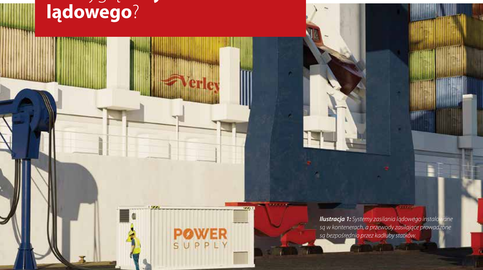
Ilustracja 1: Systemy zasilania lądowego instalowane są w kontenerach, a przewody zasilające prowadzone są bezpośrednio przez kadłuby statków.

Zasilanie lądowe pozwala zapewnić energię elektryczną każdej jednostce pływającej posiadającej własną sieć zasilającą AC, niezależnie od tego, czy jest to statek konwencjonalny zasilany paliwami kopalnymi, statek o napędzie hybrydowym, czy też statek z pełnym zasilaniem akumulatorowym.