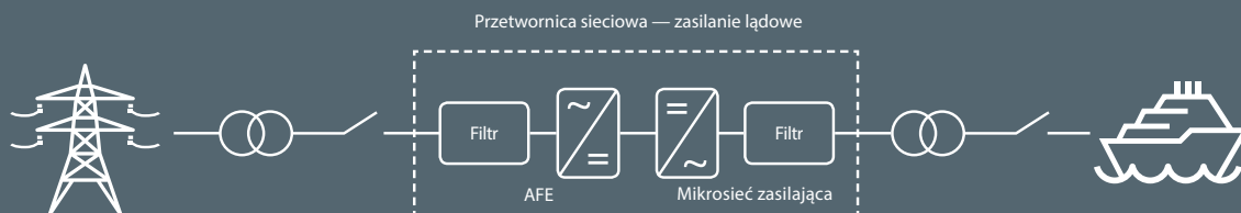
Ilustracja 2: Schemat ideowy systemu zasilania typu ląd – statek.

napięcie i częstotliwość zasilania muszą spełniać wymagania sieci jednostek pływających. Ponadto, w przypadku statków, projektanci muszą również uwzględnić zasilanie prądem zwraciovym równoległe z generatorami prądowórczymi wykorzystującymi silniki wysokoprężne, synchronizację, typy obciążenia oraz uziemienie sieci.