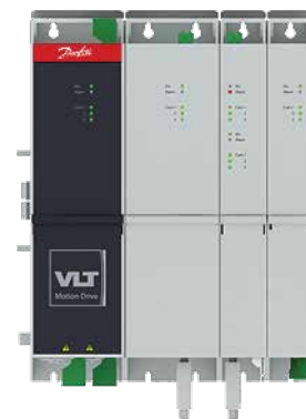
VLT® Multiaxis Servo Drive MSD 510

Der VLT® Multiaxis Servo Drive MSD 510 ist ein für viele Einsatzbereiche einsetzbares Mehrachsensystem, das die perfekte Integration dezentraler Antriebe ermöglicht. Er umfasst ein Spannungsversorgungsmodul (PSM 510), Antriebsmodule (SDM 511, SDM 512), ein dezentrales Zugriffsmodul (DAM 510) sowie ein Hilfskondensatormodul (ACM 510). Die Module sind in zwei Baugrößen mit einer Breite von 50 und 100 mm erhältlich. Sie unterstützen die Ethernet-basierten Protokolle EtherCAT®, POWERLINK® und PROFINET® IRT und verfügen über einen internen Bremswiderstand und eine Montageplatte mit Zwischenkreis und Hilfsspannungsversorgung. Die Klickverschlusslösung für die Montageplatte ermöglicht eine einfache und sichere Installation.