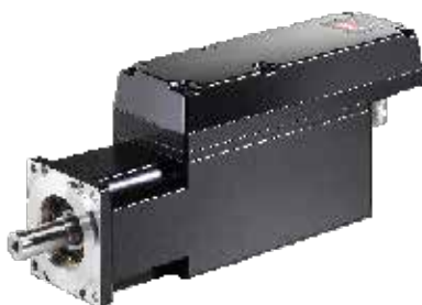
VLT® Integrated Servo Drive ISD® 510

Der VLT® Integrated Servo Drive ISD® 510 ist wesentlicher Bestandteil einer flexiblen und leistungsstarken