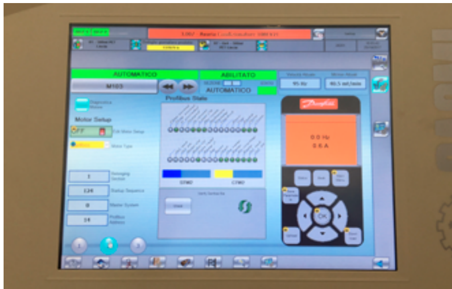
Dettaglio HMI automazione trasportatori dove Sacmi ha replicato l'LCP di programmazione dei convertitori di frequenza per eventuale modifica parametri di ciascun dispositivo senza necessità di aprire armadio elettrico.

L'automazione evoluta che Sacmi Filling ha potuto mettere in atto grazie sistema di azionamento Danfoss VLT® FlexConcept, ha permesso non solo di evitare in modo diretto l'impiego di sensori e relativi cablaggi, ma di