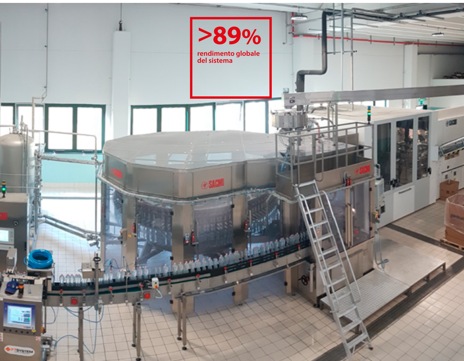
Linea imbottigliamento dedicata alla produzione di bottiglie da 1,5 l