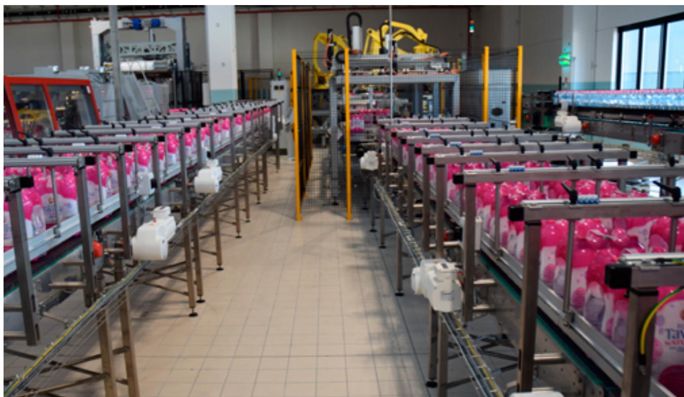
Linee di imbottigliamento in parallelo

Come già sottolineato, ogni linea è dotata di 40 motoriduttori dislocati lungo il sistema di trasporto. A questi corrispondono altrettanti inverter Danfoss VLT® AutomationDrive FC 302, posti in opportuno armadio automazione. Progettati per il controllo a velocità variabile di tutti i motori asincroni e motori a magneti permanenti sia in anello chiuso che aperto (questi ultimi scelti e adottati da Sacmi Filling per questa applicazione), sono stati pensati per aumentare la flessibilità e ottimizzare il controllo dei