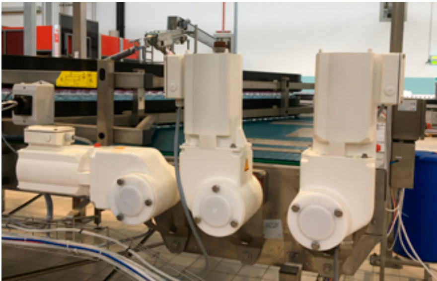
Particolare vista dei motoriduttori a magneti permanenti Danfoss VLT® One Gear Drive, installati a bordo linea. Con grado di protezione IP 69K, rispondono ai requisiti per il miglior design igienico e di pulizia.

“Un processo – conclude Frosi – allineato alle peculiarità dell’Industria 4.0, gestibile e controllabile da tablet e Pc in ogni sua fase, per il quale sono stati predisposti check progressivi di controllo in grado di segnalare qualunque non conformità delle bottiglie, scartandole senza interrompere il ciclo, dunque la produttività”